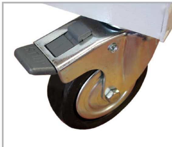
4 roulettes directrices avec blocage par freins.